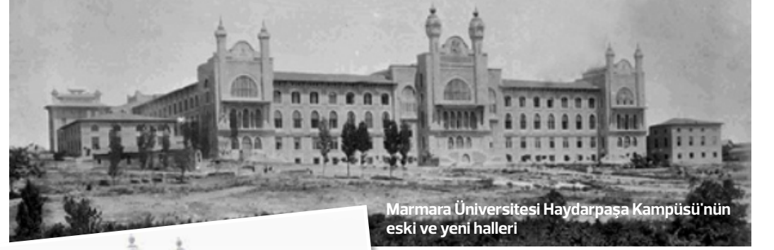
Marmara Üniversitesi Haydarpaşa Kampüsü'nün eski ve yeni halleri