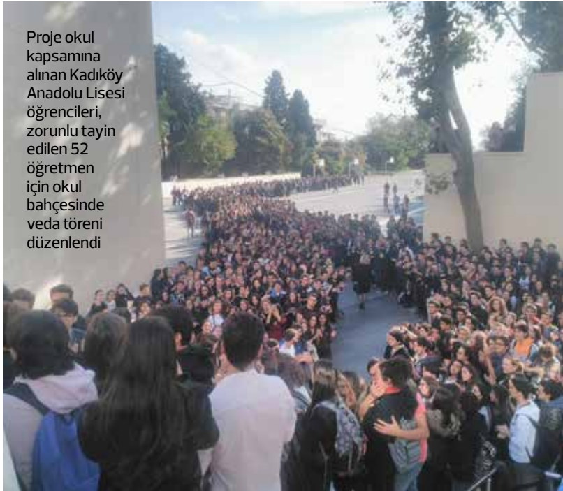
Proje okul kapsamına alınan Kadıköy Anadolu Lisesi öğrencileri, zorunlu tayin edilen 52 öğretmen için okul bahçesinde veda töreni düzenlendi

Kadıköy'ün köklü okullarından Marmara Üniversitesi ve Kadıköy Anadolu Lisesi buruk bir yıl dönümü geçiriyor. Marmara Üniversitesi Haydarpaşa Kampüsü, Sağlık Bilimleri Üniversitesi'ne devredilirken, Kadıköy Anadolu Lisesi ise 'proje okul' uygulamasıyla mücadele ediyor