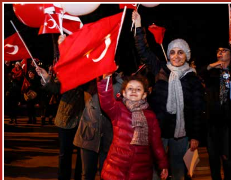
Bu yılki Cumhuriyet Yürüyüşü'ne 7'den 70'ye her yaşta Kadıköylü ve İstanbullu katıldı. Çalınan marş ve şarkılarla bayramın sevincini yaşayan vatandaşlar hep bir ağızdan marşlara eşlik etti

K adıköy Belediyesi tarafından düzenlenen geleneksel "Cumhuriyet'e Bağlılık Yürüyüşü"ne her yıl olduğu gibi bu yıl da yüz binler katıldı. Yürüyüşe katılmayan 400 bin kişi ise Kadıköy Belediyesi'nin sosyal medya hesabından yayınlanan canlı yayını izledi.