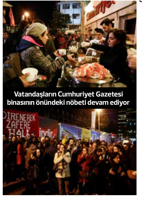
Vatandaşların Cumhuriyet Gazetesi binasının önündeki nöbeti devam ediyor