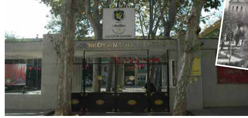
Kadıköy Anadolu Lisesi'nin 1960'lı yıllarda çekilmiş bir fotoğrafı (üstte)

ANAYASA MAHKEMESİ'NE TAŞINDI Haydarpaşa Kampüsü'nü, Sağlık Bilimleri Üniversitesi'ne tahsis eden 6639 Sayılı Kanun'un iptaline ilişkin dava, ilk incelemenin yaklaşık 18 ay önce yapılmasının ardından 2 Kasım Çarşamba günü esastan görüldü. CHP Milletvekilleri Akif Hamzaçebi, Engin Altay ve Levent Gök ile birlikte 121 milletvekili tarafından açılan davada, binlerce öğrencinin hem eğitim hayatını hem de geleceğini etkileyecek karar bekleniyor.